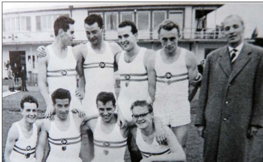
Leichtathleten in den 60er Jahren