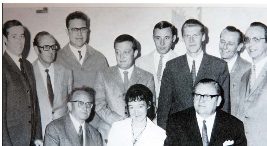
Die Vorstandschaft im Jahr 1970