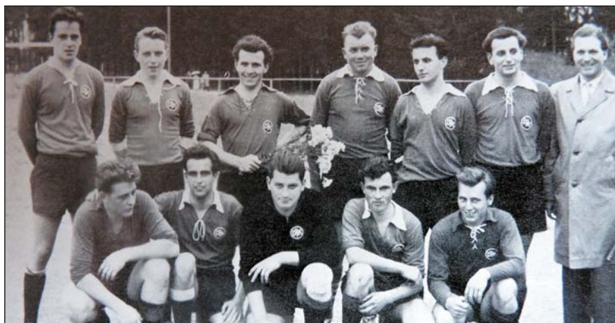
1959 - Aufstieg der 1. Mannschaft A-Klasse

Am 15. Mai 1953 wurde die DJK Villingen, die 1920 gegründet wurde, in Anwesenheit von 34 Sportinteressenten nach 18-jährigem Zwangsverbot der Nazi-herrschaft unter Leitung von Vikar Johannes Ruby wiedergegründet. Die Stille nach dem Verbot im Jahre 1935 und der zweite Weltkrieg konnten die Ideale und Tradition der Deutschen Jugendkraft nicht verschütten. Schon seit 1946 wurden wieder die ersten Versuche unternommen, die frühere DJK Sportanlage auf dem Wasserreservoir für die sporttreibende katholische Schuljugend zu erhalten, um daraus Sportgruppen in der Pfarrjugend von Villingen folgen zu lassen. Die einengenden Bestimmungen der französischen Besatzung, die zuerst nur einen allgemeinen Sportverein gelten ließen, standen zuerst hindernd im Wege. Der alte DJK Sportplatz wurde später von der