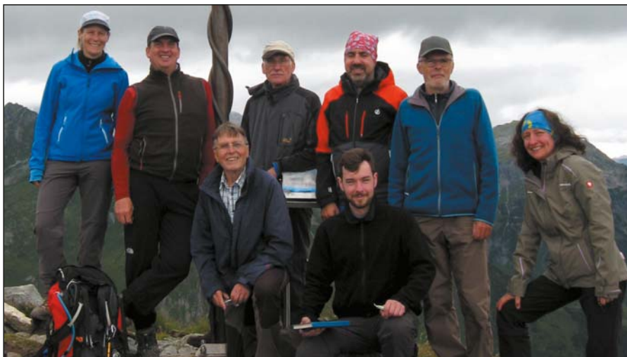
Gipfelsieg ohne Aussicht: Auf dem Gipfel der Schesaplana, 2965 m

trauen, die Ermutigung, die Hoffnung und vor allem die Kameradschaft, die während dieser 6 Tage in der Gruppe entstanden war. Bei endlich strahlendem Sonnenschein gings nun auf einem breiten Fahrweg hinunter nach Brand, vertieft in Zweiergespräche, in denen man sich gegenseitig die Erlebnisse der vergangenen Tage erzählen konnte. So verging auch hier die Zeit wie im Flug und wir waren überrascht, wie problemlos wir die 800 Höhenmeter von der Oberzalimhütte hinunter nach Brand hinter uns gebracht hatten, nachdem wir zuvor schon 800 Hm von der Mannheimer Hütte abgestiegen waren. Mit der Rückfahrt nach Freiburg gingen sechs intensive Tage zu Ende, von denen die Teilnehmer*innen noch lange zehren können.