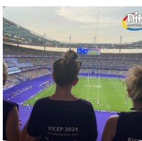
FICEP Camp 2025 24.07.-02.08. | Tschechien